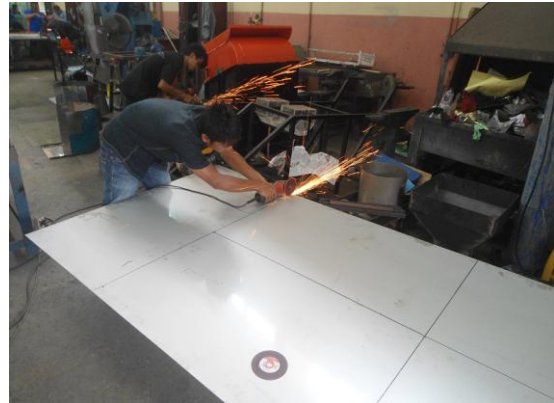
Gambar 3. Proses Pemotongan Material Silinder Presto

las TIG. Berikut proses pembuatan silinder yang dilakukan di workshop fabrikasi.