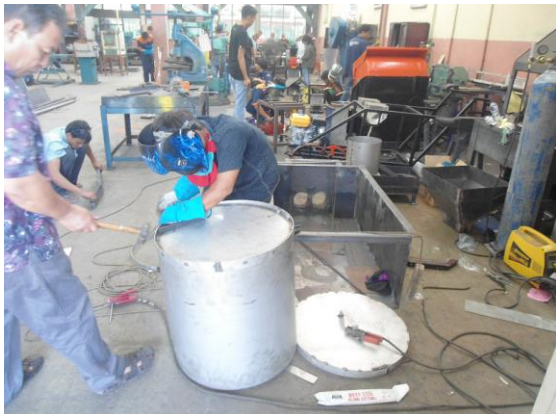
Gambar 6. Proses Pengelasan Alas pada Silinder Presto