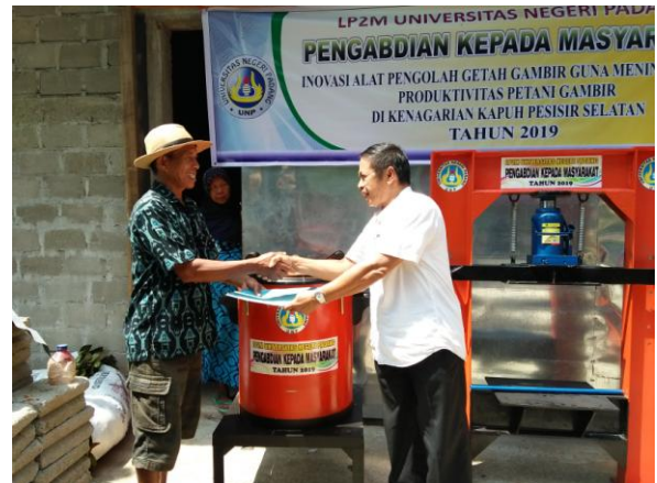
Gambar 12. Serah Terima Alat Presto Gambir dengan Pejabat Nagari