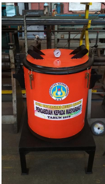
Gambar 11. Posisi Presto pada Tungku

Sebagai realisasi pengabdian kepada masyarakat dilaksanakan penyerahan dan penyuluhan pengoperasian alat yang mana di terapkan pada khalayak sasaran di Kenagarian Kapuh Kecamatan Koto XI Tarusan Pesisir Selatan. Kegiatan serah terima dilaksanakan pada tanggal 19 Agustus 2019. Para pemuka masyarakat dan pejabat pemerintahan kengarian manyabut kedatangan tim pengabdian di kenagarian Kapuh Pesisir Selatan. Berikut adalah dokumentasi saat pelaksanaan serah terima dan sosialisasi penggunaan alat presto.