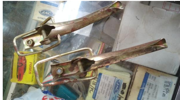
Gambar 9. Mekanisme Pengunci Presto