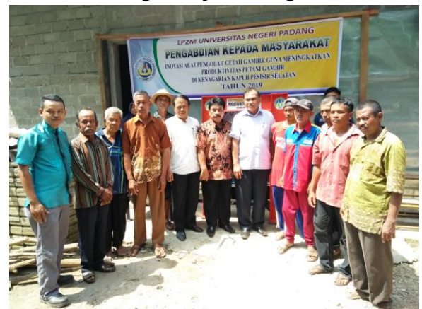
Gambar 13. Sambutan Warga di Balai Pemuda

Sebagai realisasi pengabdian kepada masyarakat dilaksanakan penyerahan dan penyuluhan pengoperasian alat yang mana di terapkan pada khalayak sasaran di Kenagarian Kapuh Kecamatan Koto XI Tarusan Pesisir Selatan. Kegiatan serah terima dilaksanakan pada tanggal 19 Agustus 2019. Para pemuka masyarakat dan pejabat pemerintahan kengarian manyabut kedatangan tim pengabdian di kenagarian Kapuh Pesisir Selatan. Berikut adalah dokumentasi saat pelaksanaan serah terima dan sosialisasi penggunaan alat presto.