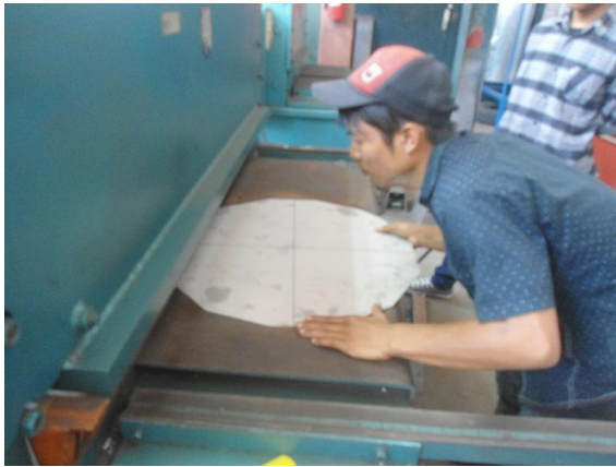
Gambar 5. Proses Pemotongan Alas dan Tutup Presto