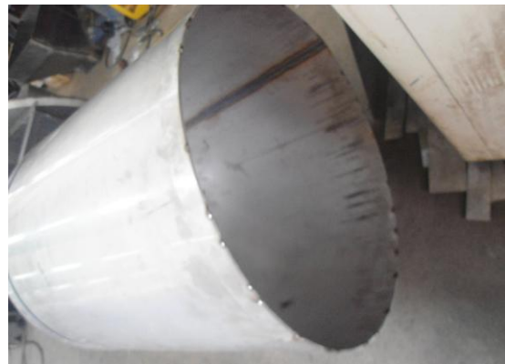
Gambar 4. Proses Pengerolan dan Pengelasan Material Silinder Presto