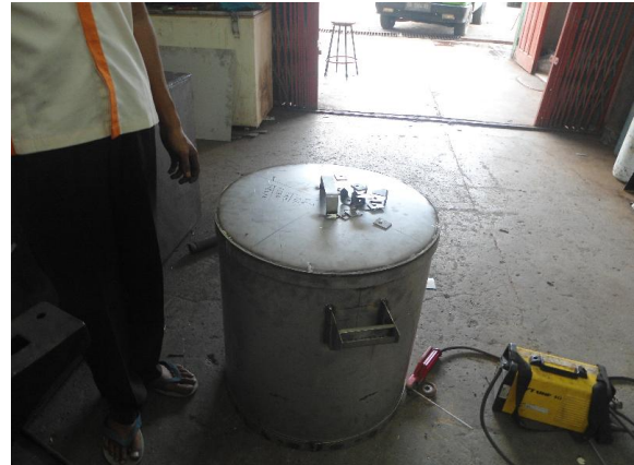
Gambar 8. Pemasangan Tutup Presto

Tutup presto dibuat dengan menggunakan plat stainless steel 2 mm dan dilengkapi dengan tuas pengunci sehingga presto ini vakum terhadap udara luar sehingga panas yang dihasilkan dapat dijaga dalam presto. Uap panas sangat berfungsi untuk pelayuan daun dalam presto.