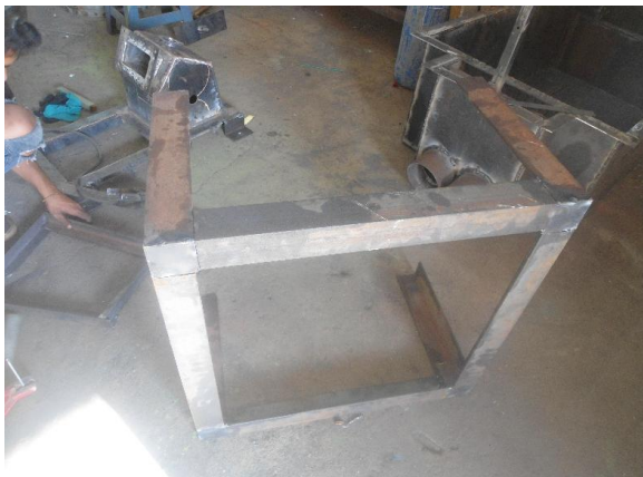
Gambar 10. Proses Pembuatan Tungku Presto